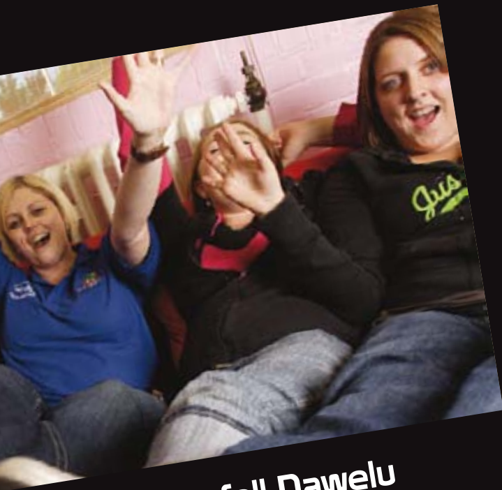
Prosiect Ystafell Dawelu Gwasanaeth Ieuenctid Bro Morgannwg, Llanilltud Fawr