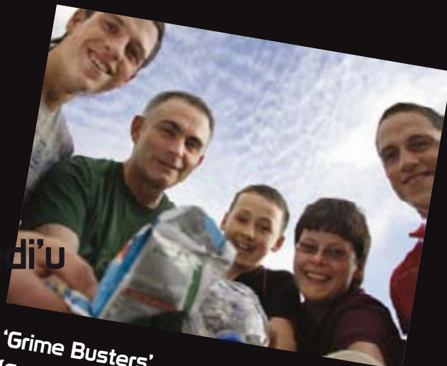
'Grime Busters' (Canolfan Ieuenctid Bodringallt) Cyngor Bwrdeistref Sirol RCT, Ystrad, Rhondda Cynon Taf

Mae'r rhai a gymerodd ran yn teimlo bod llawer wedi'u gyflawni o'r prosiect. Mae'r sefyllfa sbwriel wedi gwella'n sicr.”