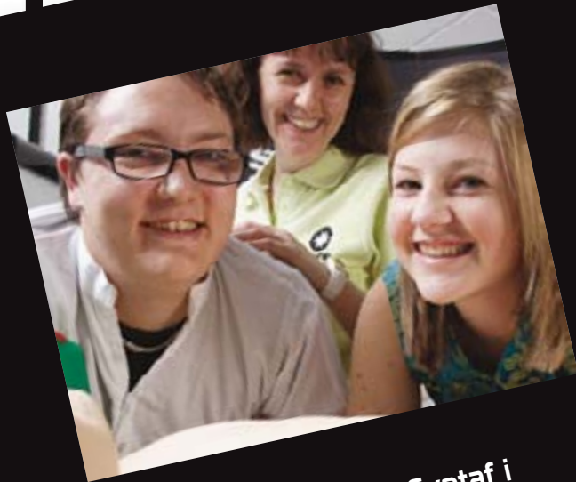
Hyfforddiant Cymorth Cyntaf i Ffoaduriaid Tibet yn India Ambiwlans Sant Ioan yng Nghymru