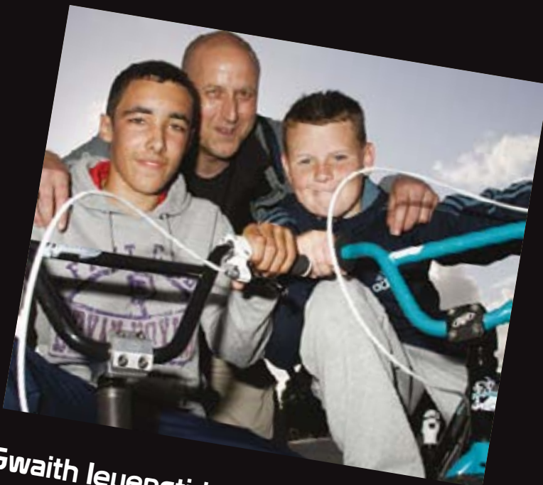
Gwaith Ieuenctid ar Strydoedd Caerdydd Cyngor Sir Caerdydd

Mae'r adnoddau a'r wybodaeth atodol, gan gynnwys gweithgareddau torri'r garw, ymarferion a thafleuni a gwybodaeth arall i bobl ifanc yn Rhan 4. Mae'r holl adnoddau a defnyddiau ar gael ar fformat y gellir ei atgynhyrchu. Darperir hefyd adnoddau eraill i gynorthwyo pobl ifanc sy'n ystyried gwaith ieuenctid fel gyrfa, a llyfryn i bobl ifanc ei gadw, o'r enw 'Allech chi fod y Sam nesaf?'.