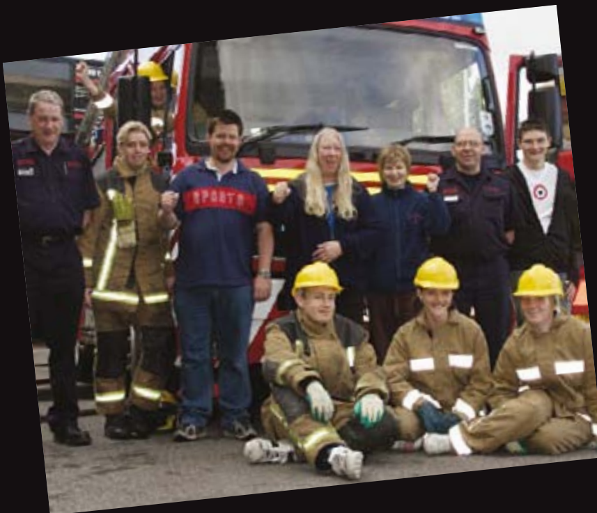
Gwobr Dug Caeredin Wreccsam

Mewn rhai sefyllfaoedd gall fod angen cyfuno rhai o'r sesiynau gan ddibynnu ar ymatebion y bobl ifanc a'r hyn y maent am ei wybod. Un o'r pethau da am waith ieuenctid yw y gall trafodaeth arwain at agweddau diddorol eraill a gellir defnyddir adnoddau neu'r wybodaeth ychwanegol sydd yn yr atodiadau i wneud hyn, er enghraifft.