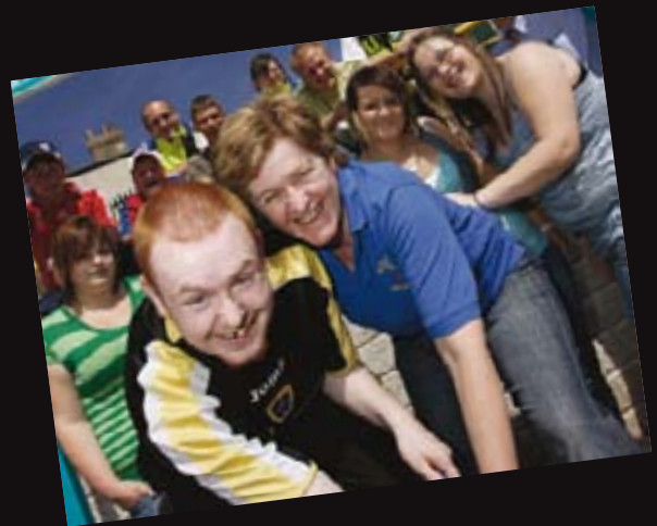
Fforwm Ieuenctid AMVYC Prosiect Ieuenctid a Chymuned Aberfan a Merthyr

Mewn canolfan ieuenctid, yn aml, mae llawer o weithgareddau'n digwydd yr un pryd ac nid yw'n orfodol i'r bobl ifanc barhau i gymryd rhan mewn gweithgaredd os ydynt yn dewis peidio. Mewn amgylchedd o'r fath, mae darparu gweithdy'n gofyn am ryngweithio dwys ac amryw byd o gymhellion i gynnal diddordeb.