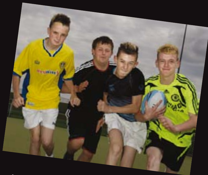
Prosiect 'Oasis' Cyngor Bwrdeistref Sirol Blaenau Gwent