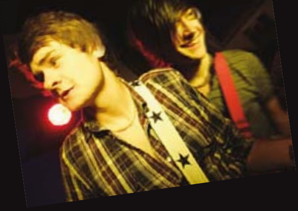
Prosiect Cornel Siaradwyr Gwasanaeth Ieuenctid Conwy, Bae Colwyn